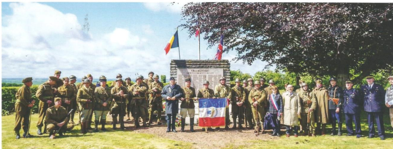
Les autorités et les figurants habillés en uniformes de 1940 devant le monument du Mont-Saint-Eloi.

Dimanche 25 mai 2025, la commune de Mont-Saint-Eloi et l'amicale des Anciens du 4 e régiment de dragons ont célébré le 85 e anniversaire des combats menés par le 4 e régiment de dragons portés les 22 et 23 mai 1940.